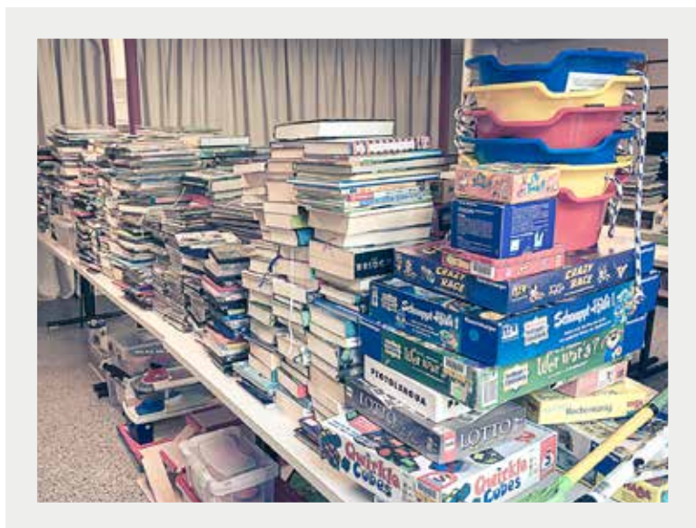
Medien in Quarantäne